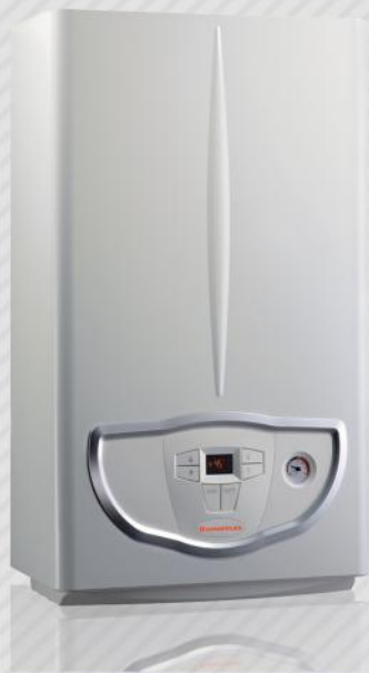
MINI EOLO PRO 28 KW

شرکت ایمرگس در سال ۱۹۶۴ در کشور ایتالیا (مهد سیستم های گرمایشی در سطح دنیا) با هدف فعالیت در حوزه سیستم های گرمایشی تاسیس گردیده است و در حال حاضر با ۵۵ سال فعالیت در حوزه سیستم های گرمایشی و با اتکا به ۱۱ مجموعه تولیدی خود در سطح دنیا، و همچنین با هدف دستیابی به کاهش حداکثری مصرف انرژی و رسیدن به حداقل آلودگی در سیستم های گرمایشی در کنار بخش تحقیق و توسعه فوق پیشرفته، به عنوان پیشرو در سیستم های گرمایشی و انرژی های نو مطرح بوده و دارای بزرگترین سهم بازار کشور ایتالیا میباشد